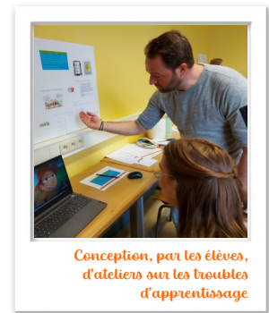
Conception, par les élèves, d'ateliers sur les troubles d'apprentissage

De la théorie, mais surtout de la pratique (exercices, ateliers, réflexions en sous-groupes, etc.)