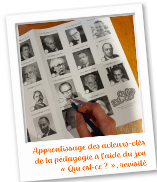
Apprentissage des acteurs-clés de la pédagogie à l'aide du jeu « Qui est-ce ? », revisité

Des activités ludiques (jeux pédagogiques, défis, micro-enseignement, etc.)