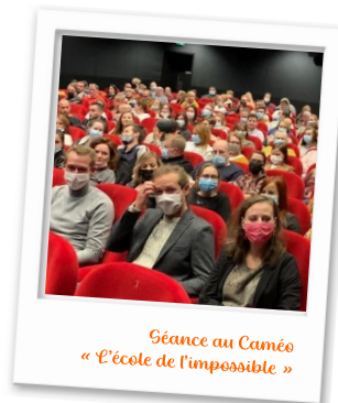
Séance au Caméo « L'école de l'impossible »

Des activités de découverte extérieures (visites, cinéma pédagogique, etc.)