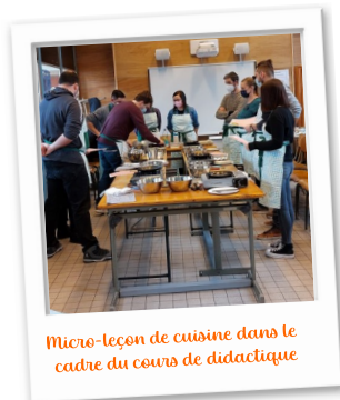
Micro-leçon de cuisine dans le cadre du cours de didactique

Des activités ludiques (jeux pédagogiques, défis, micro-enseignement, etc.)